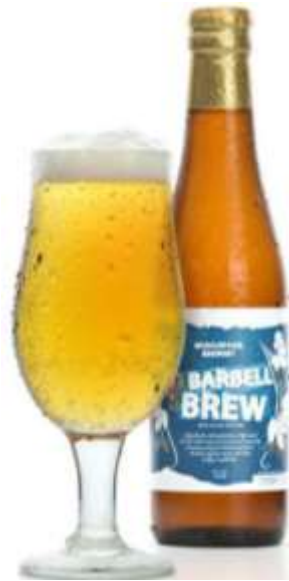
Barbell Brew (US)