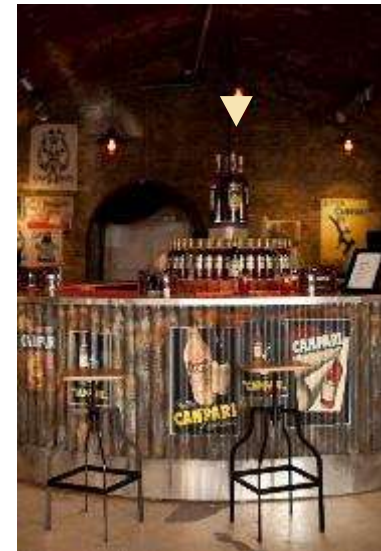
The Negroni Bar (UK)