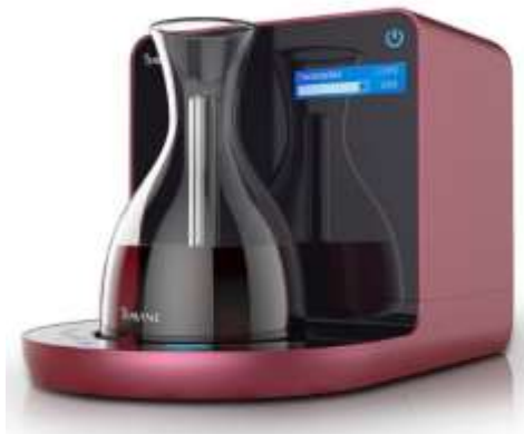
iSommelier iFavine (Global)