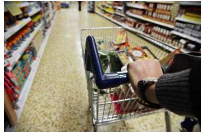
ASDA Quiet Hour (UK)