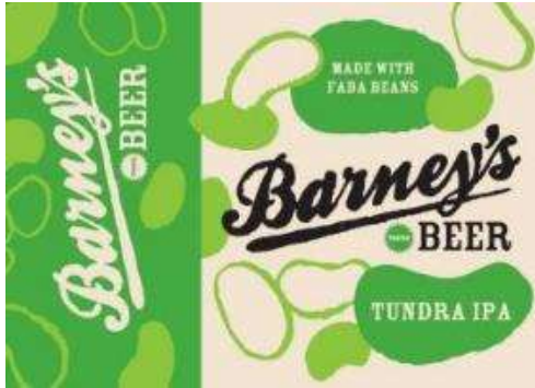
Barney's Beer (UK)