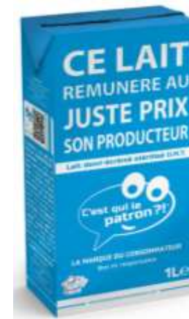
C'est qui le Patron (FCE)