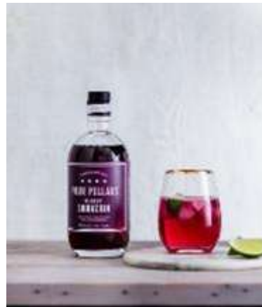
Bloody Shiraz Gin (Australia)