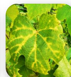
Coloration sectorielle entre les nervures