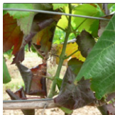
Dessèchement des inflorescences