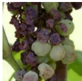
Flétrissement des grappes