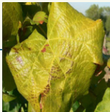
Coloration sectorielle entre les nervures